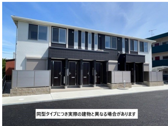
同型タイプにつき実際の建物と異なる場合があります