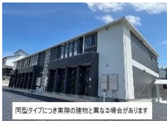
同型タイプにつき実際の建物と異なる場合があります