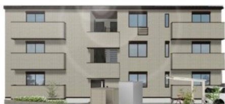
完成予想図につき実際とは多少異なる場合がございます。